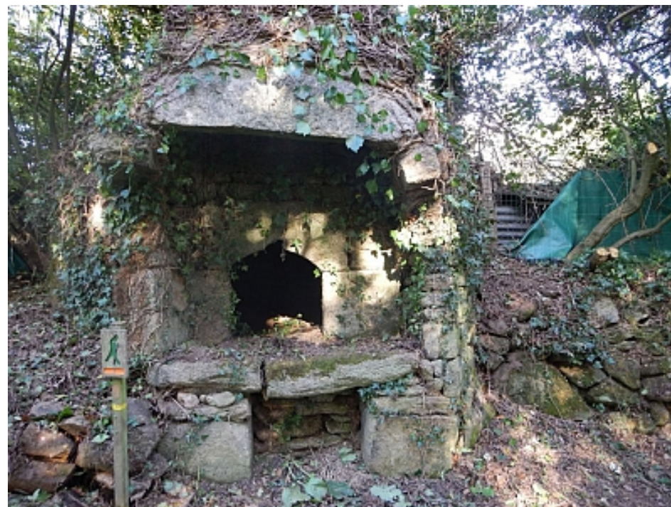
Pays Touristique Vannes-Lanvaux

Traverser et longer par le champ à gauche, jusqu'au carrefour de Kerhouarn. Tourner à droite vers les Ferrières puis descendre à gauche par le sentier forestier. Il est possible d'apercevoir le Chateau des Ferrières, propriété privée des XV et XVIème siècles. Suivre le chemin creux en fond de vallon.