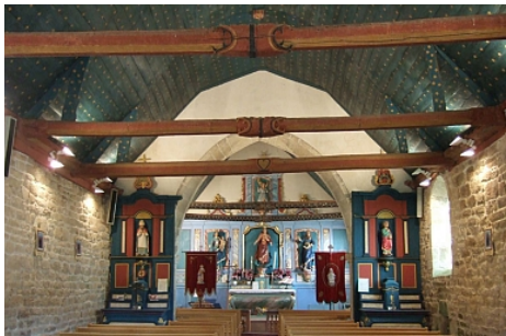
Pays Touristique Vannes-Lanvaux