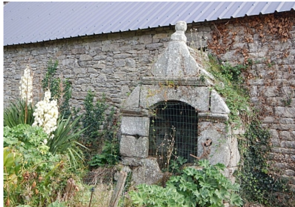
Pays Touristique Vannes-Lanvaux

Liaison vers le bourg de Sulniac par le circuit des vieux villages. Prendre, à gauche, le chemin entre saulaie et cultures. Longer le ruisseau et passer le pont Royer. S'enfoncer dans le chemin creux assez rectiligne. Le chemin creux est une particularité de la région. Un réseau très étendu permettait de relier villages, fermes et bourgs. Une haie de chaque côté offrait une protection contre la pluie ou la chaleur mais surtout les paysans avaient le droit de couper les branches secondaires pour leur bois de chauffage et le droit de racler les bouses de vache que les troupeaux déposaient. Arrivé au village du Mont, sortir du bois à droite, traverser le village et descendre par la 1ère route à droite pour retrouver le four à pain (point 2). Reprendre le chemin en sens inverse, descendre puis à la route, tourner à droite. La chapelle est à moins de 100 m.