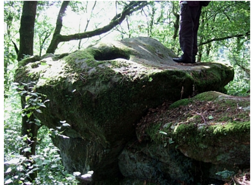
Pays Touristique Vannes-Lanvaux

A gauche du chemin, un escarpement rocheux domine le ruisseau des Ferrières. L'une des roches surplombe le coteau. Un gros bloc posé au sommet présente des cuvettes de formes arrondies ainsi que des rigoles creusées dans le granite. La légende raconte que c'était le lieu de sacrifice humains et le sang de victimes coulait en cascades le long du rocher.