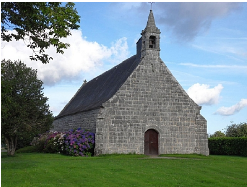
Pays Touristique Vannes-Lanvaux

Au panneau, se diriger vers le village de Sainte-Marguerite par la route. Tourner à gauche au premier carrefour. Puis, s'engager à droite dans un chemin creux jusqu'au four à pain, à l'entrée du village du Mont.