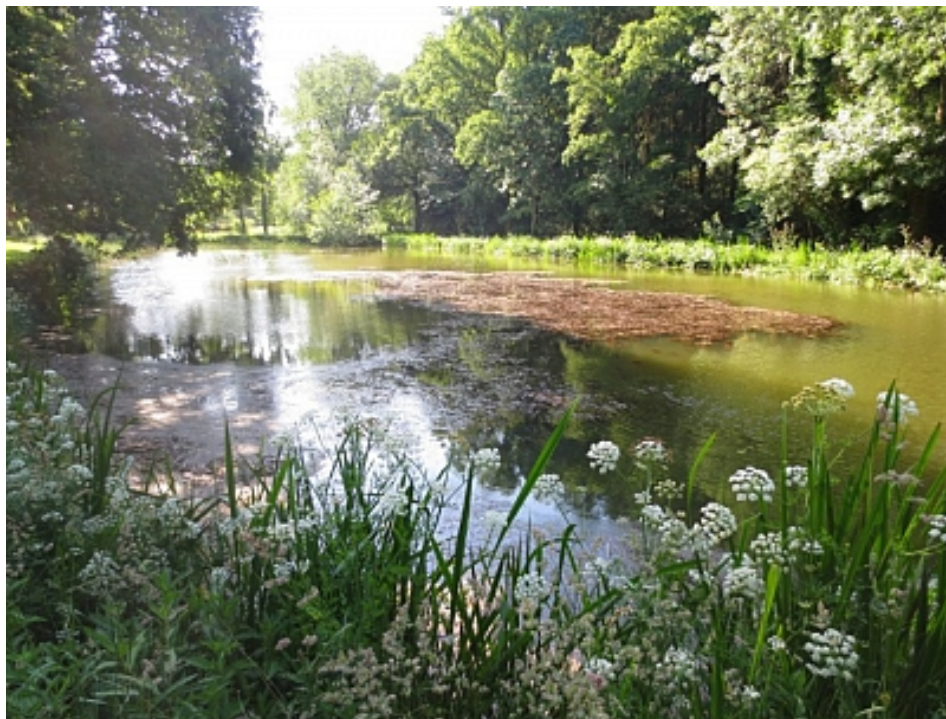
Tourisme Arc Sud Bretagne

Un agréable étang à la sortie du bourg classé de Noyal-Muzillac. L'endroit idéal pour se détendre ou faire un pique-nique après ou avant votre marche.