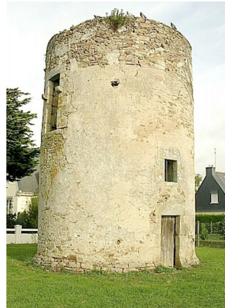
Tourisme Arc Sud Bretagne

Le quartier de la Marinière conserve encore deux moulins à vent appelés "les moulins d'Antoine". Un de ces moulins tours se trouve au bord de l'itinéraire et a perdu son toit. Le second se situe un peu plus bas, beaucoup plus haut et reconstruit, vous pouvez l'apercevoir lors de votre balade.