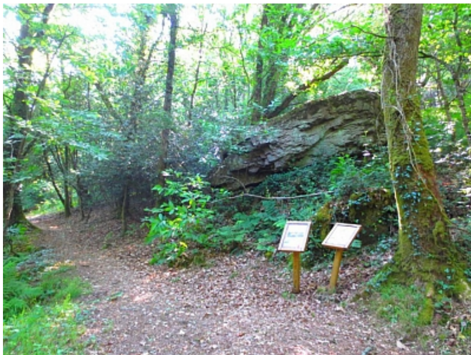
Tourisme Arc Sud Bretagne

Vous allez croiser, au bord du ruisseau, d'imposants rochers. Une tradition locale associe la présence du plus imposant au géant Gargantua de Rabelais. La légende raconte que Gargantua, en traversant la Bretagne, aurait laissé tomber un caillou de sa chaussure. C'est ce rocher appelé "la Gravelle" que vous découvrez ici.