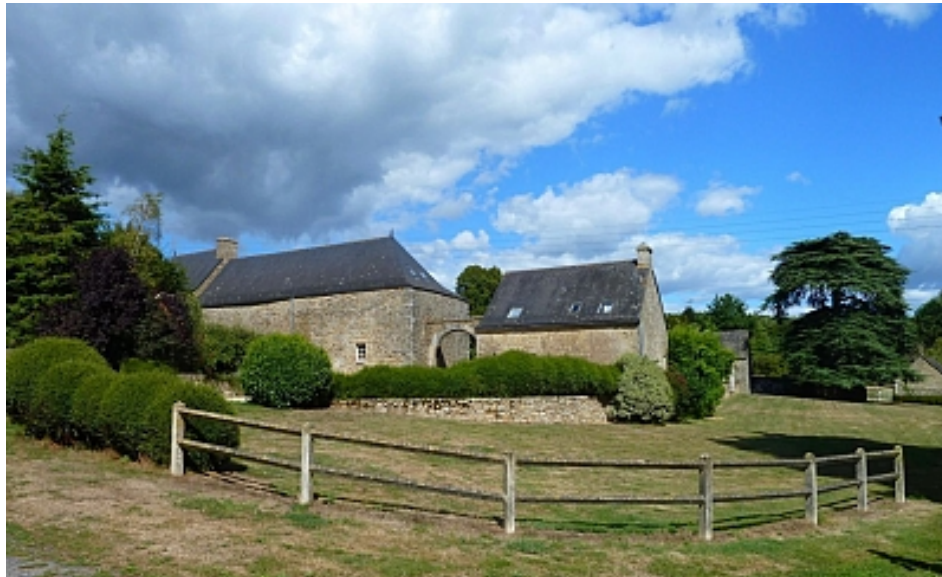
Tourisme Arc Sud Bretagne | Morbihan

Le circuit conduit au site de Séréac où, après avoir croisé le château privé (photo), propriété de la famille de Muzillac au Moyen-Age, vous arrivez au village de la Fuié qui tient son nom du colombier encore visible aujourd'hui à l'entrée du lieu-dit. Symbole de la puissance de la noblesse sous l'ancien régime, le nombre de ses boulins (niches) dépendait de la surface des terres seigneuriales.