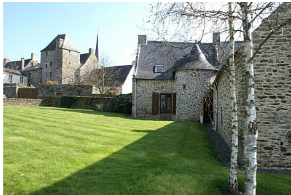
Tourisme Arc Sud Bretagne

Le circuit revient dans le centre classé « Bourg du Patrimoine Rural de Bretagne » avec, en particulier, ses résidences Renaissance aux remarquables lucarnes et tours d'escalier. L'église St Martin est représentative de l'évolution architecturale en conservant des éléments de la période romane, gothique et classique. D'imposants tableaux du 17e siècle ainsi que des statues polychromes enrichissent son mobilier.