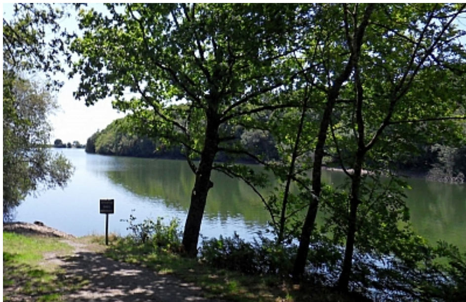
Pays Touristique Vannes-Lanvaux

Redescendre en tournant toujours à droite vers Bizole par le chemin d'exploitation.