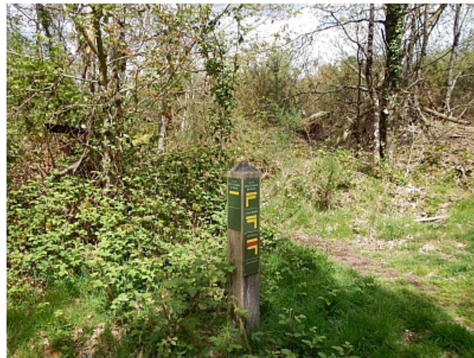
Pays Touristique Vannes-Lanvaux

En face, longer le bois à partir du panneau d'interdiction aux véhicules jusqu'à l'embranchement Bizole - Randrécart.