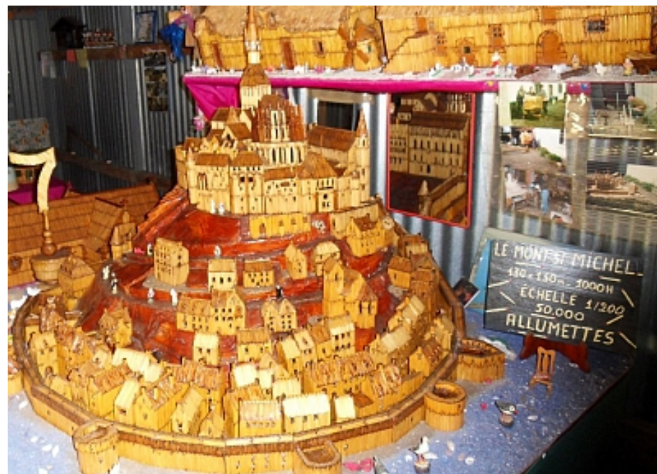
Pays Touristique Vannes-Lanvaux

Ce musée privé présente les oeuvres d'un homme passionné qui pendant 30 ans, avec infiniment de patience a réalisé 29 maquettes de châteaux, cathédrale, basilique, chaumières...avec des allumettes ! Plus d'informations sur www.tourisme-vannes.com/voir-faire/visites-et-decouvertes/112291-musee-des-chateaux-en-allumettes