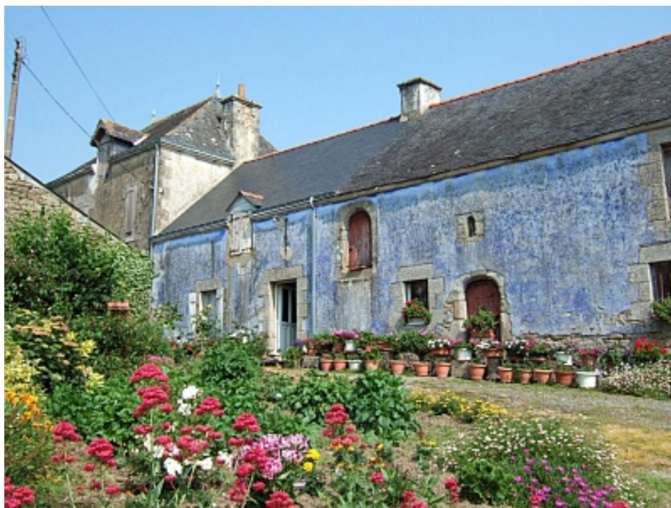
Pays Touristique Vannes-Lanvaux

A la Chapelle, suivre la route à droite en direction de Treffléan. A la sortie du village, après la dernière maison sur la gauche, monter par le chemin à gauche jusqu'à une fourche. Continuer sur la droite dans la forêt.