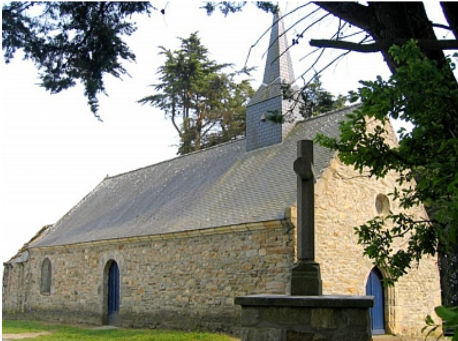
Tourisme Arc Sud Bretagne

Cromenac'h signifie en breton « grotte du moine ». Il existait un monastère primitif qui a été détruit par une forte tempête et remplacé par cette chapelle, dédiée à saint Tugdual, qui est attestée au XVII e siècle. Située à quelques mètres de l'Océan, un panorama s'offre à vous de la falaise.