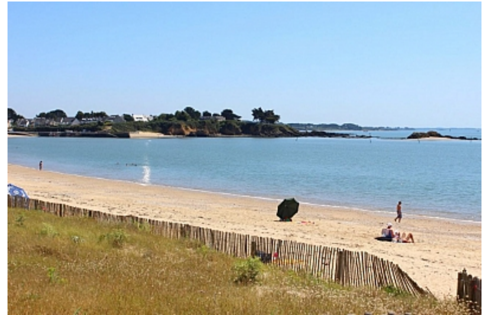
Tourisme Arc Sud Bretagne | Morbihan

En abordant cet ancien village de pêcheurs aux longères du 17 e siècle, vous pouvez rejoindre l'Océan et parcourir la dune aménagée et découvrir ainsi la richesse de sa flore. A la pointe, vous faites face au Port de Billiers à la Pointe de Pen Lan, où est basé la chaloupe traditionnelle "Belle de Vilaine".