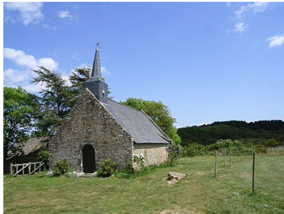
Tourisme Arc Sud Bretagne | Morbihan

Dominant le site de la vallée du Saint Eloi et ses anciens marais salants, la chapelle de St Mamers, face à l'Océan, est représentative des modestes chapelles rurales.