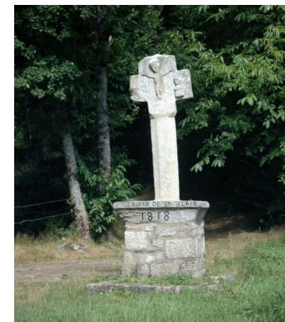
Croix de Saint-Clair