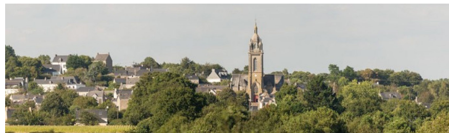
Vue de Limerzel

www.rochefortterre-tourisme.bzh - 02 97 26 56 00