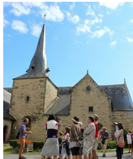
Tourisme arc Sud Bretagne

Le circuit traverse Lantiern avec sa chapelle, classée aux Monuments Historiques, fondée par les Templiers au 12e siècle. Le village conserve de nombreuses maisons de notable des 16e et 17e siècles.