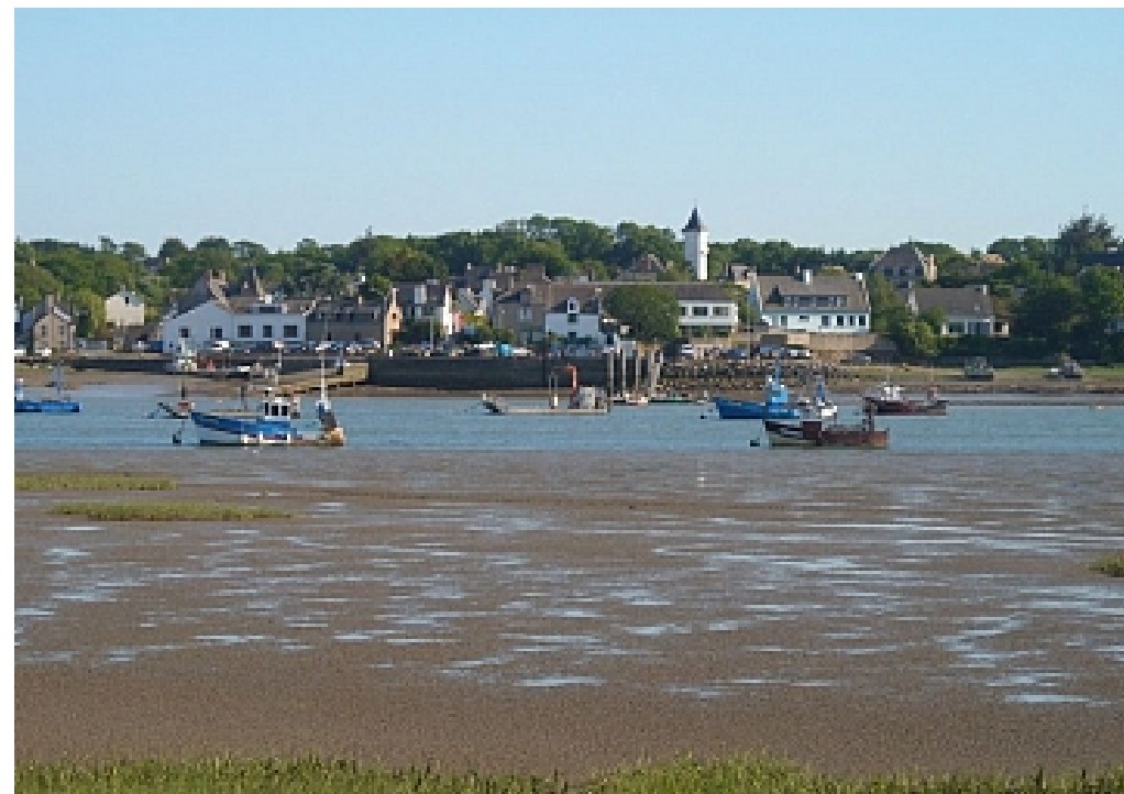
Tourisme Arz Sud Bretagne | Morbihan