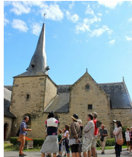
Tourisme arc Sud Bretagne

Le circuit traverse Lantiern avec sa chapelle, classée aux Monuments Historiques, fondée par les Templiers au 12e siècle. Le village conserve de nombreuses maisons de notable des 16e et 17e siècles.