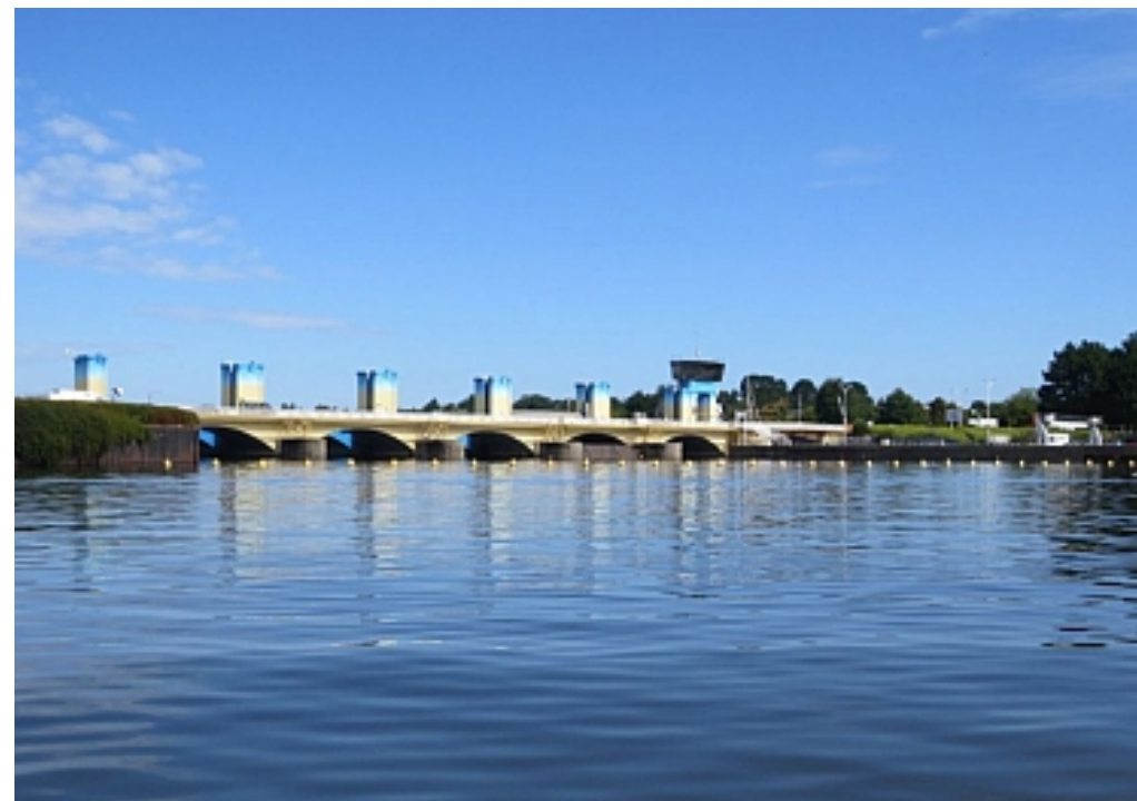
Tourisme Arz. Sud Bretagne | Mobilhian