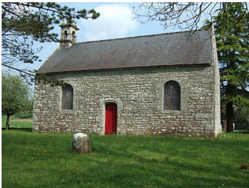
Pays Touristique Vannes-Lanvaux

La chapelle St Aman se trouve tout au nord de la commune de St Nolff, à la limite de Monterblanc. L'origine remonte au XVIème siècle, en 1528 par la volonté de Bernard de Quifistre, recteur de St Nolff, et chanoine à la Cathédrale de Vannes. Les portes chanfreinées en anse de panier sont caractéristiques de l'architecture de cette époque. L'édifice a été fortement modifié au XVIIème siècle. De taille modeste, le plan est rectangulaire. Un petit clocher ajouré est orné de 5 croix, une à chaque angle. La chapelle est dédiée à Saint Aman, évêque de Vannes au VIème siècle. Devant la chapelle se trouve une pierre hémisphérique, monument funéraire appelé stèle gauloise ou lec'h. L'enceinte de la chapelle est clôturée par un muret percé d'un basen ou échelier, pour éviter que les animaux ne pénètrent dans la partie sacrée.