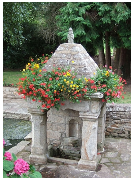
Pays Touristique Vannes-Lanvaux

Attenante au lavoir, la fontaine date du XVII ème siècle. Elle a la forme traditionnelle du Pays de Vannes, un petit temple. Le toit en pyramide repose sur des colonnes chanfreinées. Il est surmonté d'une statue récente de St Pierre.