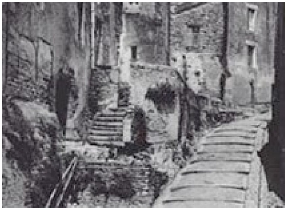
Office de Tourisme | Damgan, La Roche-Bernard, Muzillac