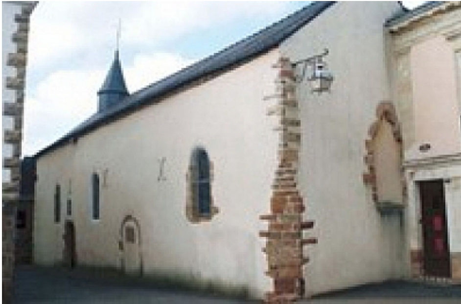
Office de Tourisme | Damgan, La Roche-Bernard, Muzillac