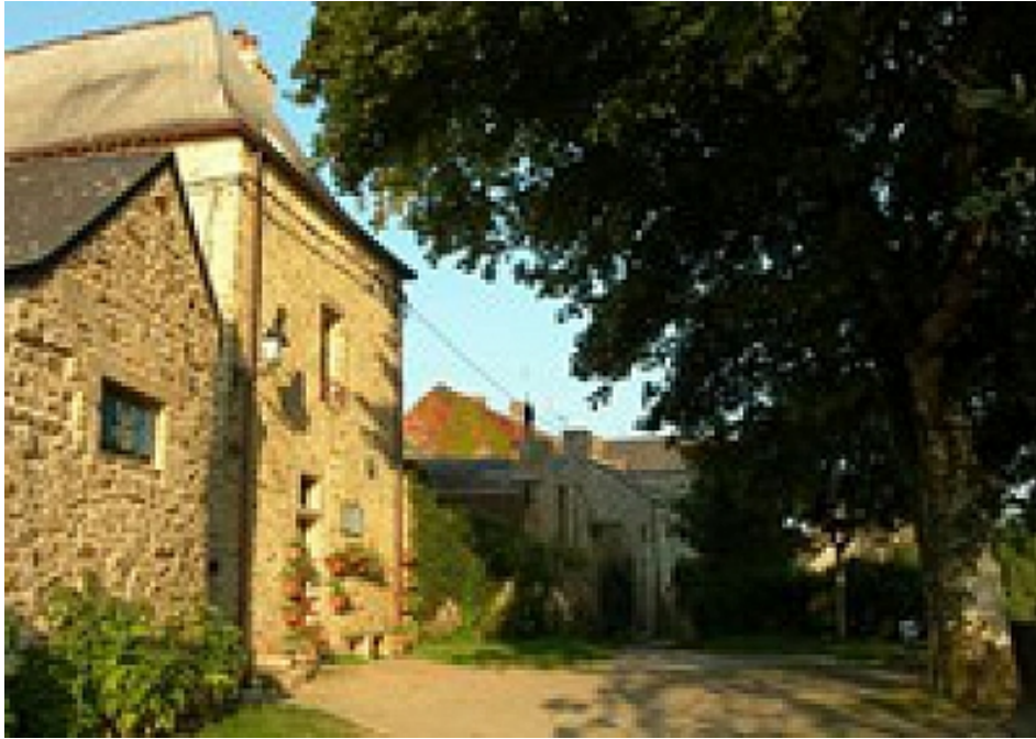
Office de Tourisme | Damgan, La Roche-Bernard, Muzillac