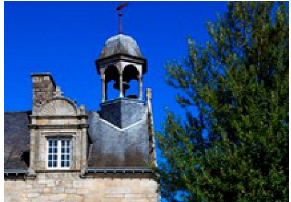
Office de Tourisme | Damgan, La Roche-Bernard, Muzillac

A La Roche-Bernard, le père et la mère La Roche sont un peu fâchés. Le père s'est installé sur la façade de la mairie, notez où il se trouve