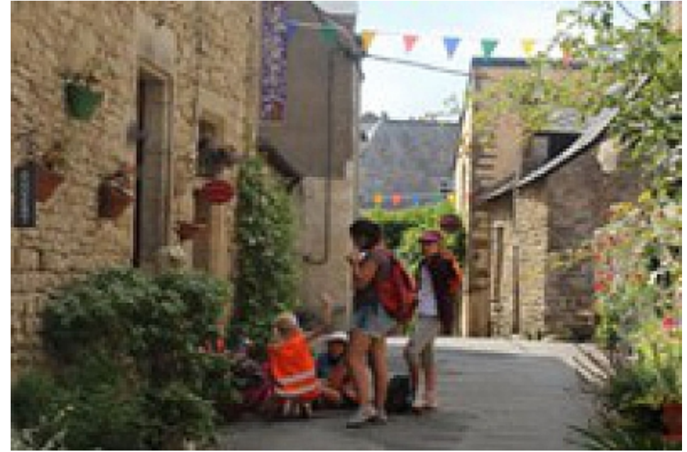
Office de Tourisme | Damgan, La Roche-Bernard, Muzillac

Levez la tête et regardez les toits et les fenêtres. De quelle manière les gens montaient-ils les marchandises ?