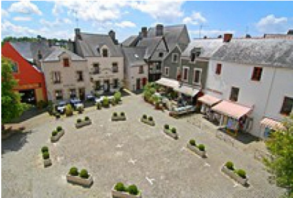
Office de Tourisme | Damgan, La Roche-Bernard, Muzillac