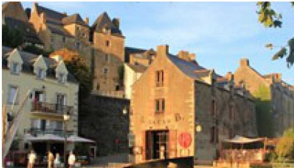
Office de Tourisme | Damgan, La Roche-Bernard, Muzillac