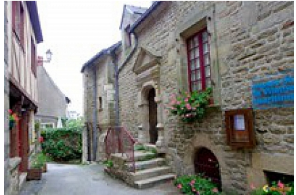
Office de Tourisme | Damgan, La Roche-Bernard, Muzillac