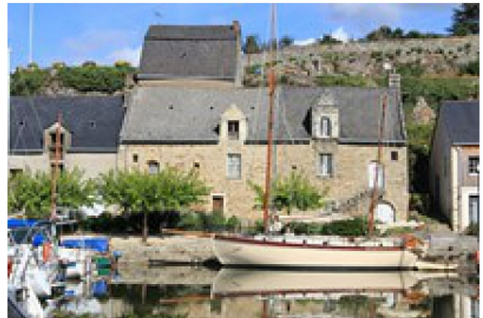
Office de Tourisme | Damgan, La Roche-Bernard, Muzillac

Un élément au pied du chemin menant au rocher vous donnera un indice. Un autre produit servait lui à amender les champs.