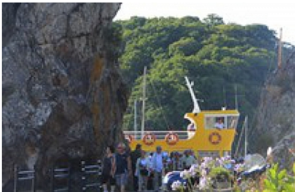
Office de Tourisme | Damgan, La Roche-Bernard, Muzillac

Des petits trous circulaires dans la roche devraient vous aider à trouver la réponse