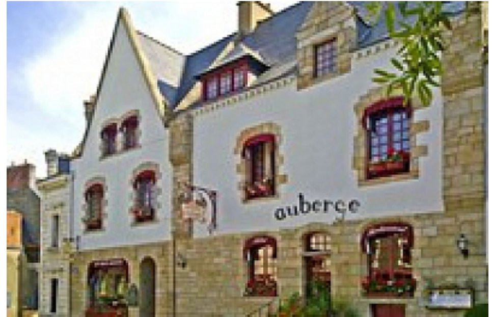
Office de Tourisme | Damgan, La Roche-Bernard, Muzillac