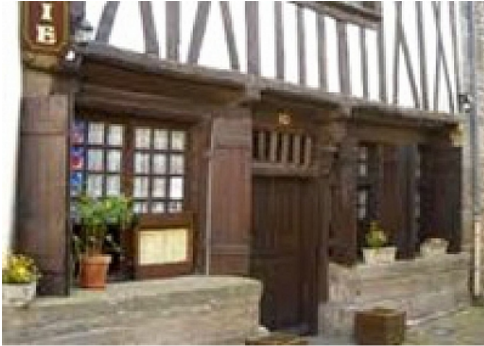
Office de Tourisme | Damgan, La Roche-Bernard, Muzillac