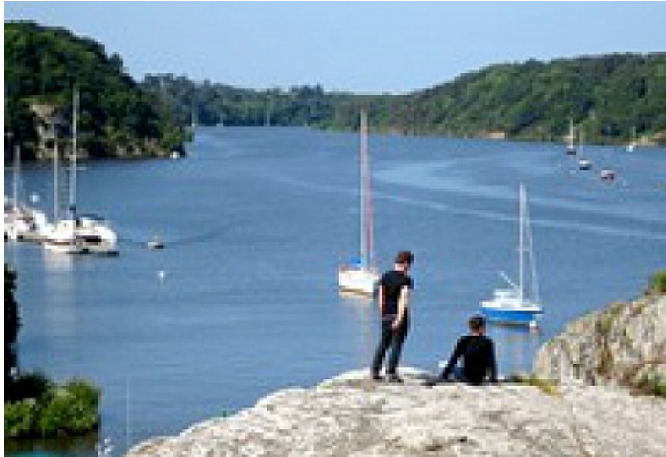
Office de Tourisme | Damgan, La Roche-Bernard, Muzillac