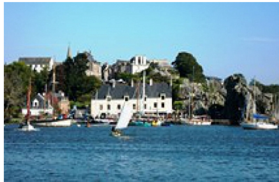
Office de Tourisme | Damgan, La Roche-Bernard, Muzillac