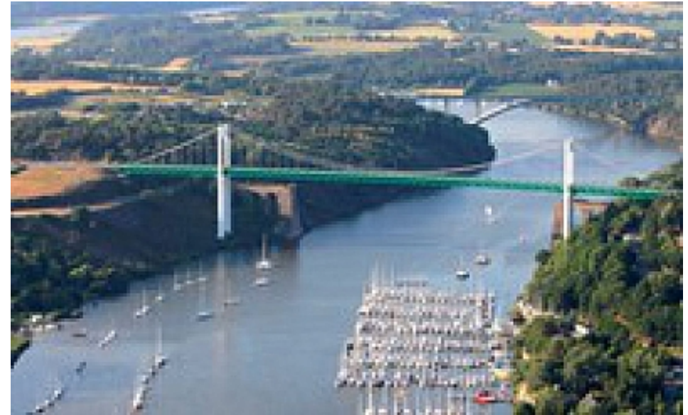
Office de Tourisme | Damgan, La Roche-Bernard, Muzillac