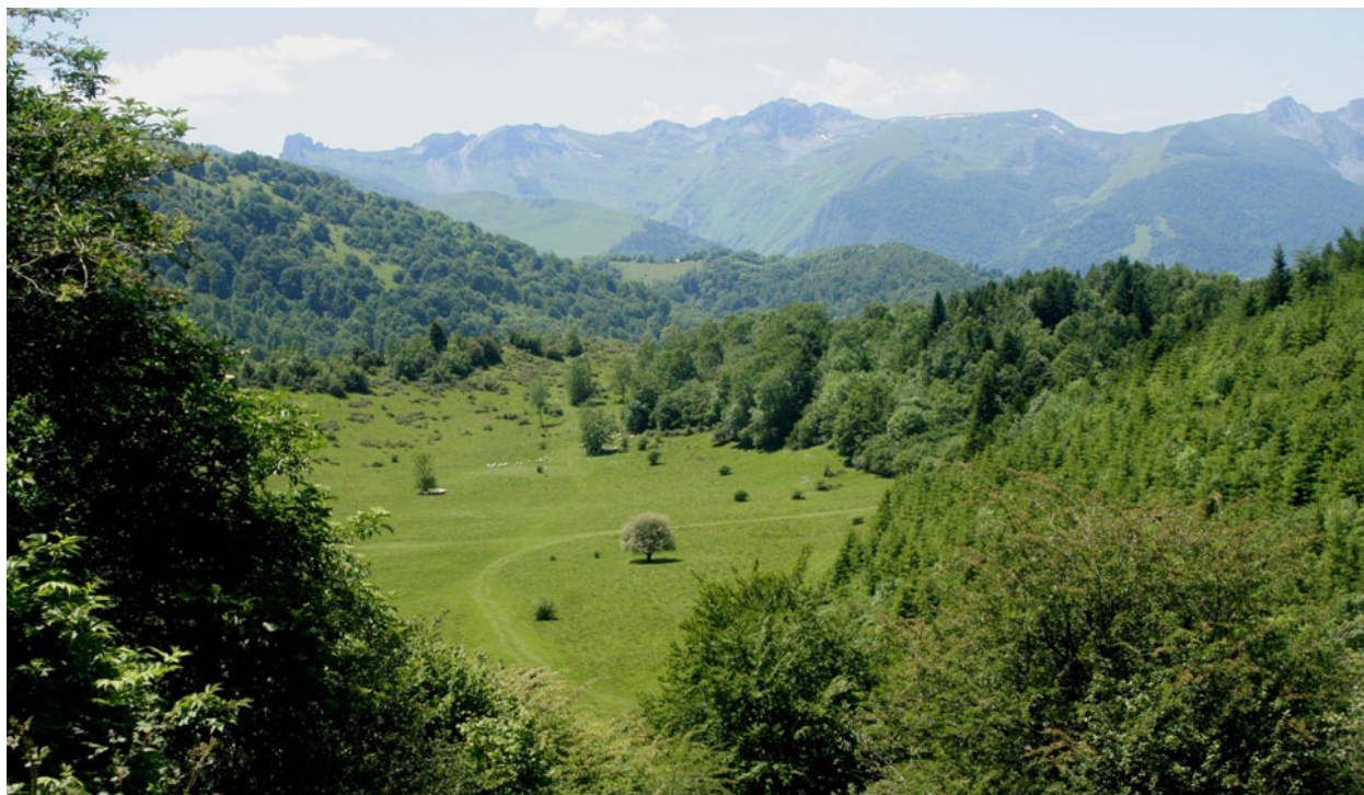
Le plateau du quartier Ugès